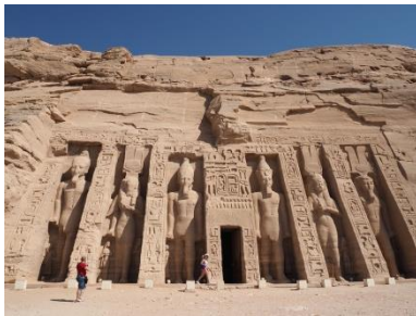
Abu Simbel

Wir laden Sie ein, mit Hilfe unserer Fotogalerie auf unserer Homepage noch einmal einzutauchen in nunmehr 46 Reisen und Veranstaltungen aus 9 Jahren. Auch für das kommende Jahr bieten wir Ihnen wieder attraktive Ziele mit überschaubaren und – wie immer – aufgeschlossenen Reisegruppen an.